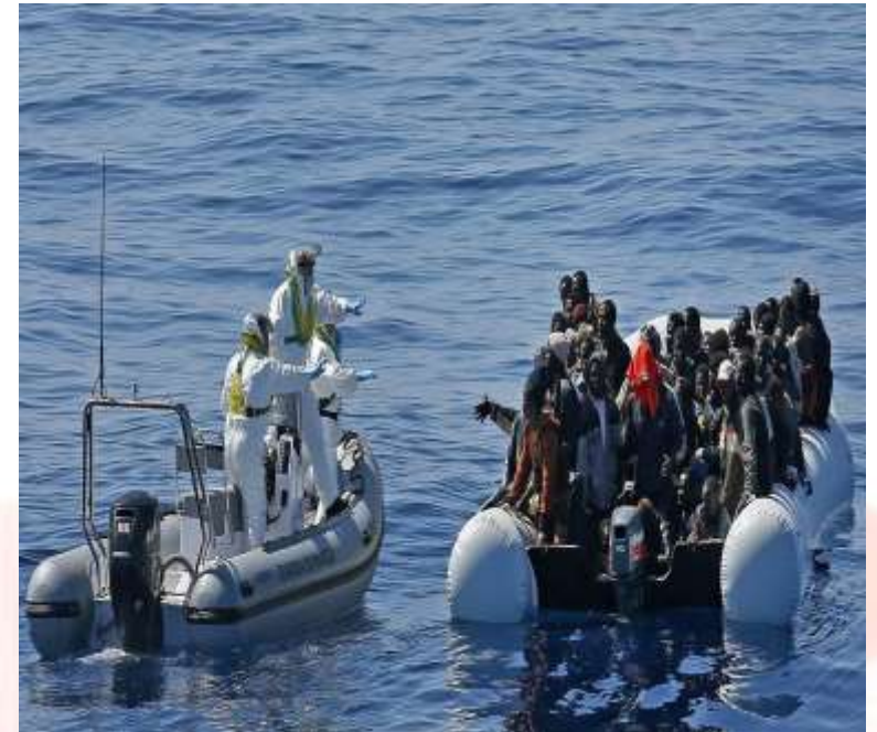
Amnistía Internacional, España (2015) Imagen de las costas de Lampedusa, Italia. Disponible: https://www.es.amnesty.org/en-que-estamos/noticias/noticia/articulo/cuando-me-rescataron-senti-que-habia-vuelto-a-nacer-la-historia-de-ali/

*Spena, A. (2016). Human Smuggling and Irregular Immigration in the EU: From complicity to exploitation? En S. Carrera y E. Guild (Eds.), Irregular migration, trafficking and smuggling of human beings. Policy dilemmas in the EU (pp. 33-40). Bruselas: Centre for European Policy Studies.